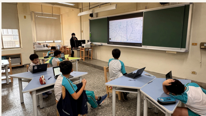
旅遊行程 田野×規劃×畢業旅行