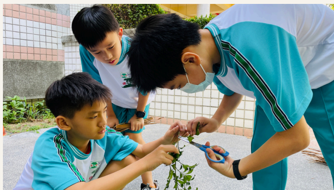
創造力 創意×生活×創新思維