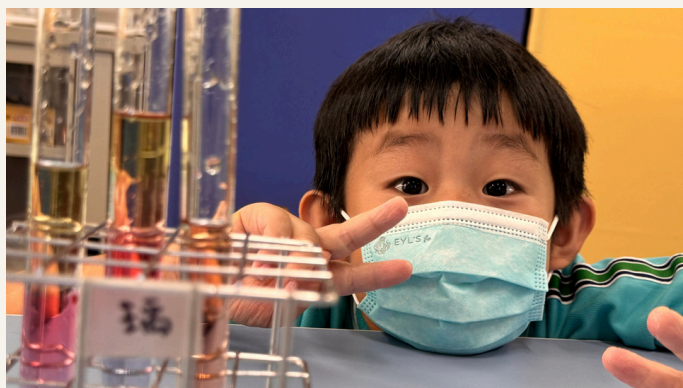
獨立研究 知識×實驗×做中學